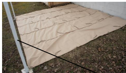
Ourlet côté gouttière

Positionnez sur le sol votre toile de telle façon que l'ourlet de la toile se trouve sous l'emplacement de la gouttière.